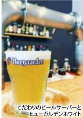
こだわりのビールサーバーと ヒューガルデンホワイト

大小さまざまな滝の魅力をメインに、忍者やサンショウウオなどでも知られる名張市の観光名所、赤目四十八滝。この時期は夏の清流から秋の紅葉へと季節の移ろいを満喫する観光客でにぎわっています。滝の入口近く、旅館や土産物店が並ぶエリアで昨年5月から話題を集めているのが、大きな三角屋根が目目を引くトマルカフェSANKAKUです。