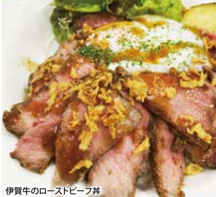
伊賀牛のローストビーフ丼