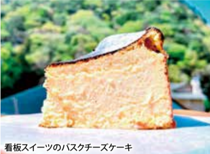
看板スイーツのバスクチーズケーキ