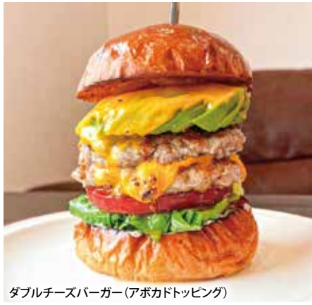
ダブルチーズバーガー(アボカドトッピング)