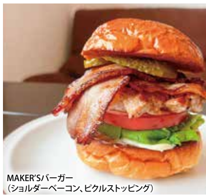
MAKER'Sバーガー(ショルダーベーコン、ピクルストッピング)