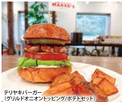
テリヤキバーガー(グリルドオニオントッピング/ポテトセット)